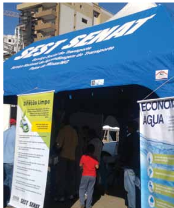
Unidade de Patos de Minas realizou ações pela cidade

Em Patos de Minas, a data foi comemorada em parceria com a Prefeitura Municipal de Meio Ambiente, e diversos órgãos e instituições. Foram realizadas solenidades no Parque Municipal do Mocambo; palestra da Copasa sobre a estrutura e funcionamento da Estação de Tratamento de Esgoto (ETE) no Plenário da Câmara de Vereadores, seguida de visita à ETE; visita ao aterro sanitário no distrito de Boassara; blitz ambiental na Praça do Fórum; barqueata com mutirão de limpeza do rio e plantio de mata ciliar no rio Paranaíba; oficina de plantio e distribuição de mudas de árvores e oficina de Identificação Botânica com Herbáreo. ■