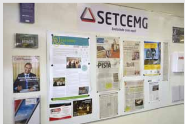
Pit Stop: notícias de quem está a serviço das associadas

Desde junho, a Fetcemg e o Setcemg têm um Jornal Mural editado pelo Departamento de Comunicação das entidades com o apoio de todos os colaboradores.