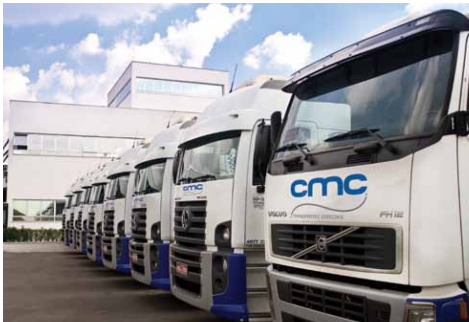
CMC: meta para os próximos anos é ampliar o mercado de atuação e atender outros segmentos

A CMC Transportes dispõe de um robusto corpo administrativo, composto por profissionais atuantes em diversas áreas, comprometidos