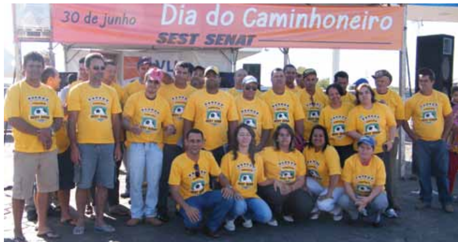
Comemoração em Contagem foi marcada por ações culturais e de saúde

Em Pirapora, a comemoração foi realizada no pátio do Posto Vila e Entrepósito da FCA, com sorteio de prêmios e distribuição de brindes. Os caminhoneiros