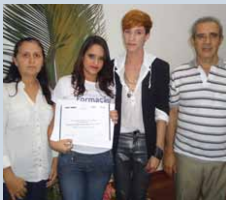
Formatura do curso de Maquiagem foi o destaque

A proposta do desfile foi demonstrar a beleza dos animais das florestas brasileiras, transferindo para a maquiagem suas cores e características