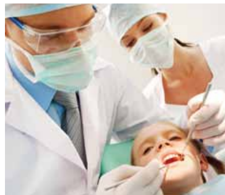
A prevenção evita o desenvolvimento de problemas mais graves

Para aproveitar os serviços odontológicos do Sest, basta agendar um orçamento, que é gratuito. O atendimento na unidade do Serra Verde é realizado de segunda a