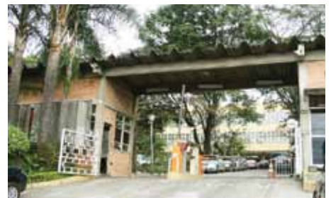
Empresas disponibilizarão vagas para alunos do Cefet-MG

As empresas interessadas em participar do programa disponibilizarão para o Cefet-MG as vagas de estágio e caberá à coordenação do curso encaminhar os alunos interessados de acordo com