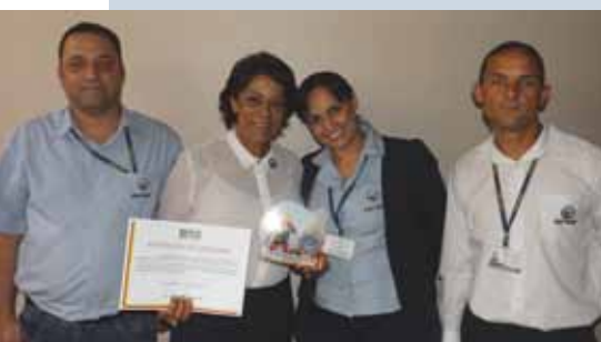
Equipe do Sest Senat com o certificado e troféu

Nas comemorações pelo Dia Nacional do Bombeiro, celebrado no dia 2 de julho, a 2ª Cia BM/5º BBM de Patos de Minas homenageou a unidade do Sest Senat da cidade.